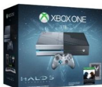
XBOX ONE 1 TERA $1,450,000