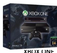
XBOX ONE KINEKT 500GB $1,399,000